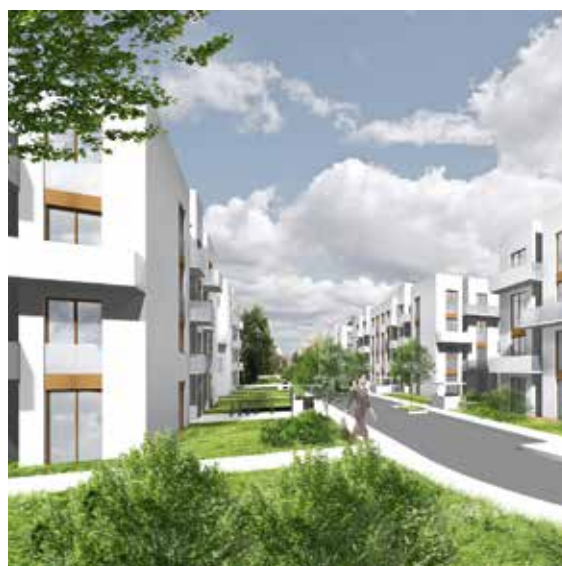
Abb. 1.: Außenansicht

Urban, grün, bezahlbar, diese Eigenschaften beschreiben das Leitmotiv für die Entstehung der neuen Wohnsiedlung in Potsdam. Da diese Vorgaben bereits bei zahlreichen vergleichbaren Projekten in der Vergangenheit die Grundlage für städtebauliche Konzepte und hochbauliche Entwürfe bildeten, wurde dieser Wettbewerb bewusst in das Erbe der klassischen Moderne platziert.