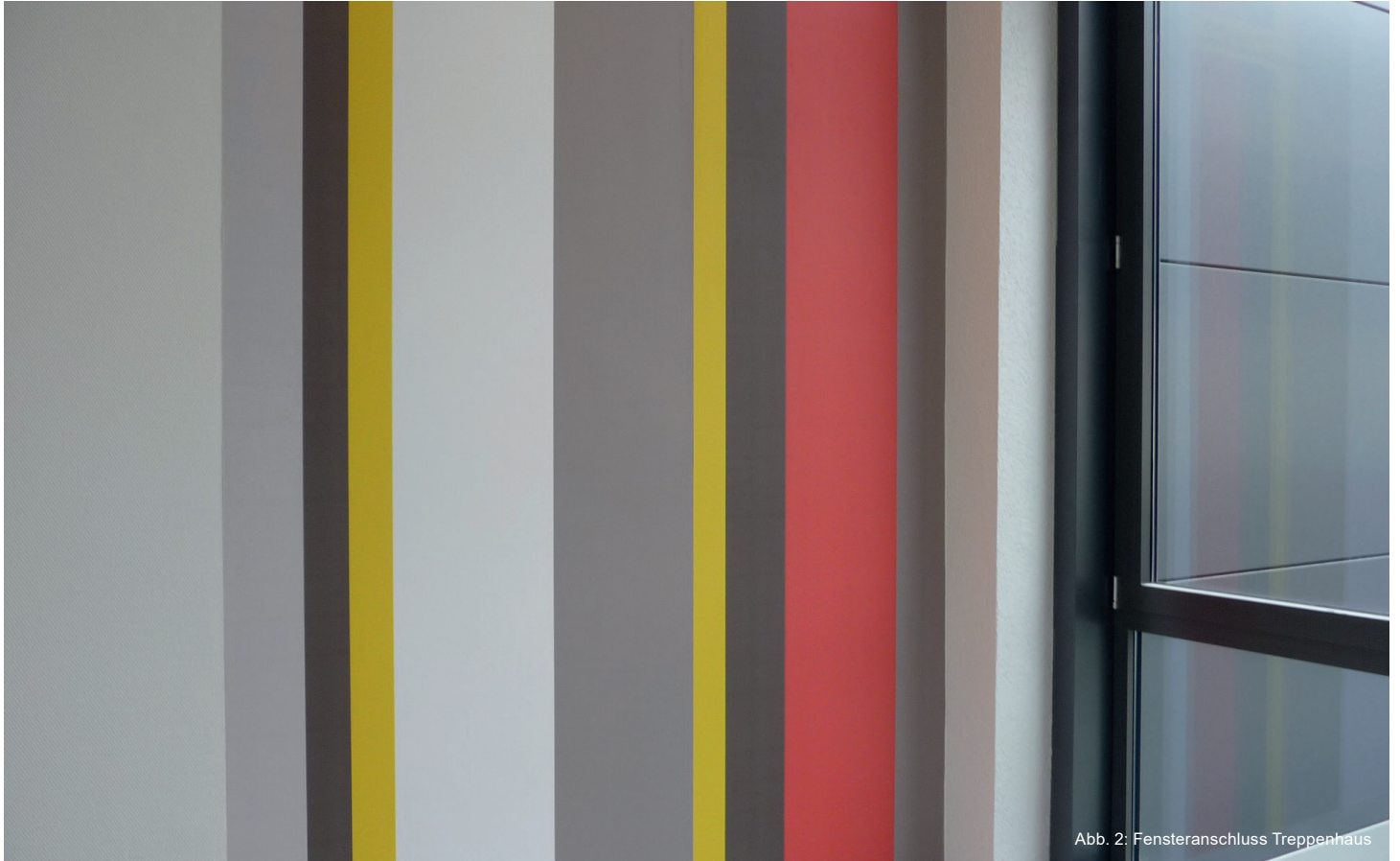
Abb. 2: Fensteranschluss Treppenhaus